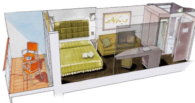
Immagine a solo scopo illustrativo; le dimensioni, la disposizione e l'arredamento possono variare (all'interno della stessa categoria di cabina).